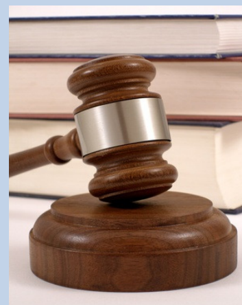
Der europäische Gerichtshof hat zugunsten lediger Väter entschieden.

www.bundesverfassungsgericht.de/pressemitteilungen/bvg7-03.htm